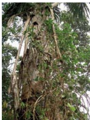
Banisteriopsis caapi pnące porastające palme